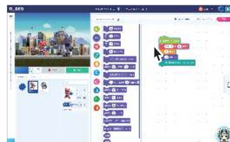
QUREOプログラミング教室の教材

QUREOプログラミング教室でも ブロックをつかった ビジュアルプログラミングを学ぼう!