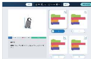
試験問題イメージ

レベル1~4では ビジュアルプログラミング （ブロックなどの視覚的なオブジェクトをつかったプログラミング）が試験問題に採用されています。